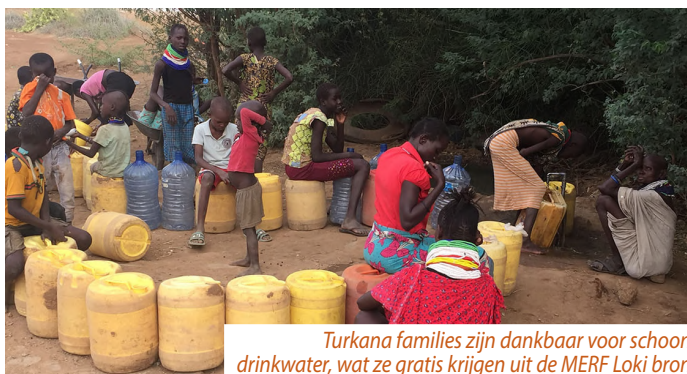
Turkana families zijn dankbaar voor schoon drinkwater, wat ze gratis krijgen uit de MERF Loki bron