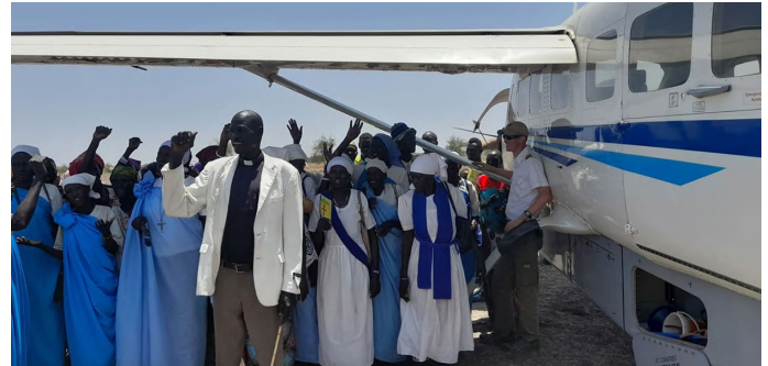
Het charter vliegtuig wordt enthousiast ontvangen door de Zuid Soedaneze dominee en het Kerk Koor

Het afgelopen jaar had de Covid pandemie ook impact op de activiteiten van het MERF Centrum. Als gevolg van de maatregelen van de Keniaanse overheid, moest de eerste cursus van 2020 twee weken eerder stoppen en andere werden geannuleerd. In januari 2021 konden de cursussen hervat worden. Echter door reisbeperkingen konden er geen gastdocenten uit andere landen komen. In plaats daarvan namen lokale mannen, die beschikbaar waren, de taak op zich om te onderwijzen, gebruik makend van het Augustinus Programma. Door de nieuwe lockdown in maart 2021