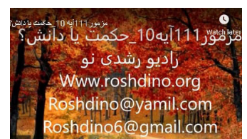
Rechtstreekse online radio evangelisatie in het Farsi

MERF's internationale online conferentie werd door de Ethiopische teamleider afgesloten met een overdenking over Psalm 67 : 2 en 3. De Heer gaat door met zegenen. Met Zijn aangezicht schijnend over ons, gaat het werk van MERF door. Christus' reddende genade wordt in veel landen verkondigd tot verheerlijking van Zijn naam.