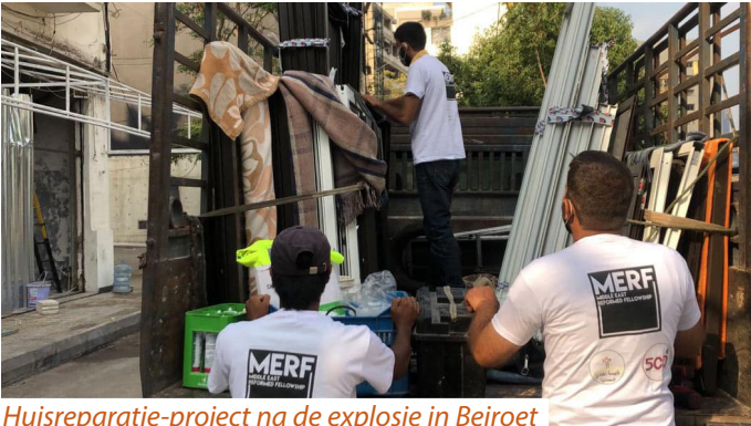
Huisreparatie-project na de explosie in Beiroet

men eerst onverschillig was of zich afkeerde. De Heer zorgde ervoor dat er teams van klussers en vrijwilligers gevormd konden worden. Ze hebben meer dan 600 huizen gerepareerd en meer dan 2000 mensen konden geholpen worden met voedsel en medicijnen. Alle praktische hulp ging gepaard met geestelijke zorg, luisteren, bidden en distributie van evangelisatie literatuur. Voor 2021 is er nazorg gepland voor de duizenden individuen en families waarmee contact gelegd is.