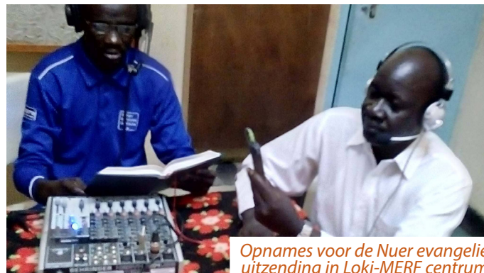
Opnames voor de Nuer evangelie uitzending in Loki-MERF centrum

De groeiende kerk in de Arabische wereld is een bemoediging. Ook bemoe-