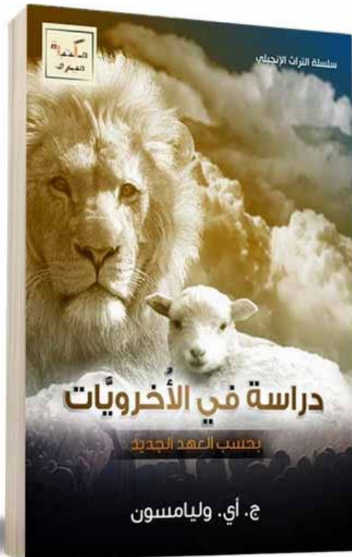
Studies in Eschatologie door G I Williamson

Na veel bidden en afwegen en nadat de Heer heeft voorzien in een gekwalificeerde staf, is een ambitieus project gestart: Een nieuwe Arabische website en een Facebook pagina om goede Arabische Christelijke literatuur en Bijbelstudies gemakkelijk toegankelijk te maken voor de wijdverbreide en groeiende Arabische kerken, in het bijzonder voor dominees, onderwijzers en andere geestelijk leiders.