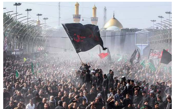
In Karbala, Irak, houden Sjieten ieder jaar een emotionele herdenking van het Soennitische bloedbad onder hun oprichters.