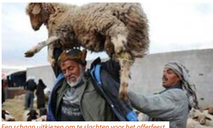
Een schaap uitkiezen om te slachten voor het offerfeest