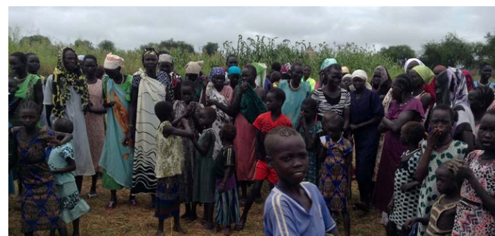
Zuid-Soedanezen verwelkomen bezoekers in hun gemeenschap

Ik behandelde in Loki deel 4 van de Augustinuscursus, over de bijbelboeken Marcus, Daniël en Exodus. De studenten kregen werkboeken over Marcus en Daniël, en terplekke maakte ik hand-outs over Exodus, met de nadruk op Christus' vervulling van de typen in dit boek. Het