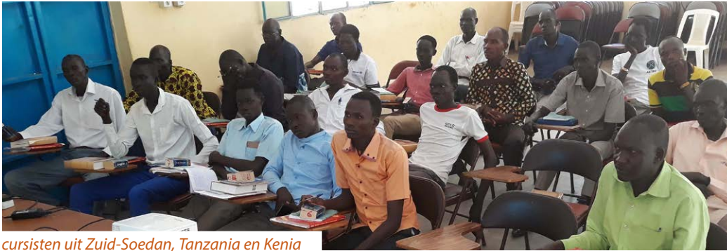
cursisten uit Zuid-Soedan, Tanzania en Kenia

seerd in het materiaal om lokaal Bijbelonderwijs in Tanzania verder te ontwikkelen. In juni/juli organiseert hij een conferentie. Dit kan een gelegenheid zijn om zijn werk te bezoeken en meer lesmateriaal mee te nemen.