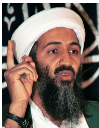
voor miljoenen Soennieten, blijft Osama Bin Laden een held.