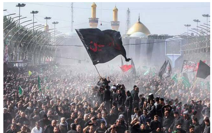
In Karbala, Irak, houden Sjieten ieder jaar een emotionele herdenking van het Soennitische bloedbad onder hun oprichters.

Uw gift is heel welkom op IBAN-rekeningnr. NL17 INGB0003156094 t.n.v. CSM, Meppel